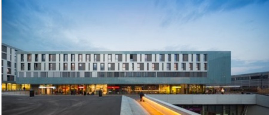
Neubau Studentisches Wohnen auf dem Campus der Hochschule Lausanne, EPFL