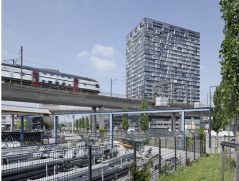
Das 80 Meter hohe Haus ist als Hotel- und Wohnturm konzipiert.