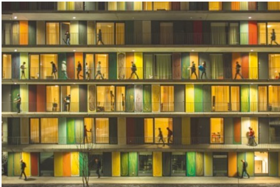
Das Werk „Chromosome“ von der Künstlerin Catherine Bolle.